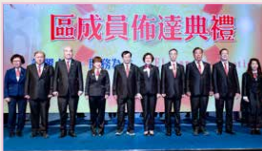
聯誼長與督導長團隊