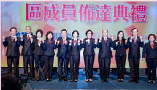
秘書長、財務長及其副職

方靜靜總監最高指導指出除了國際5大服務，美麗總監任內會在培養人才、女性會友發展上更加強，當場表彰羅秘書長所屬的千禧獅子會捐獻6部救護車難能可貴。