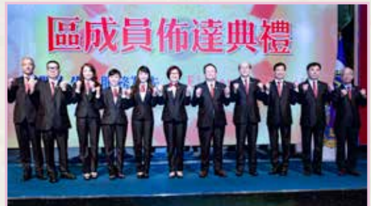
公關長與活動長團隊