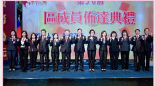
GST & LCTF 團隊