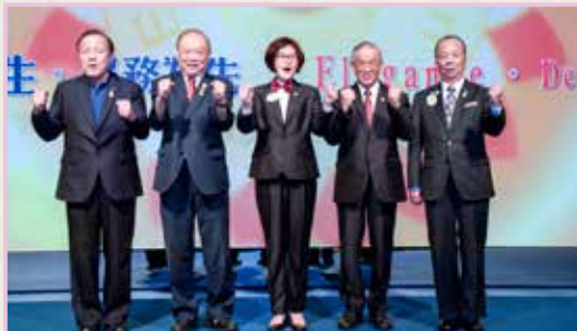
講師團與教學顧問