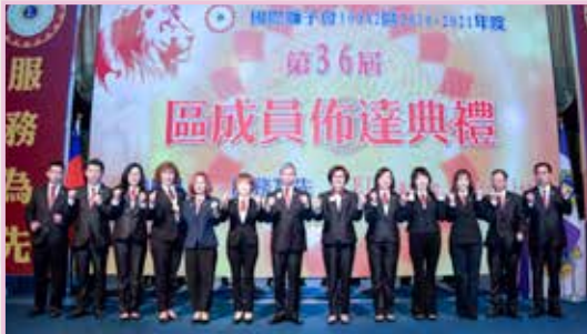
GLT & GMT 團隊