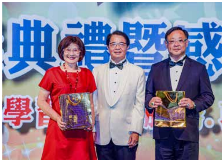
總監繼續頒獎給25年以上逢五逢十的資深獅友，最資深的是北區一位獅友獅齡已55年；以及七十歲以上逢五逢十的長青獅友，年紀最長的是中區羅重台100歲。