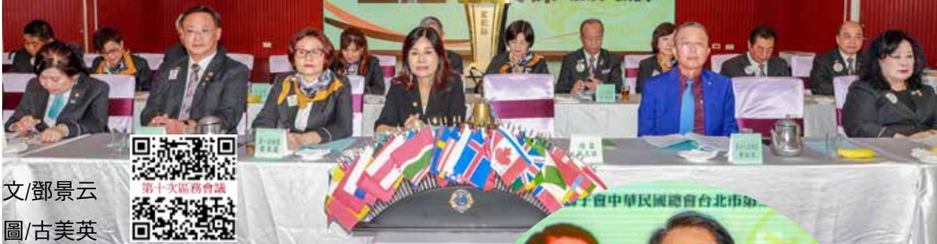
文/鄧景云 圖/古美英