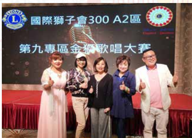
記者與鄒主席評審老師合影