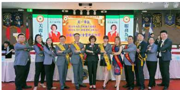
圖文 / 採訪委員 黃明智