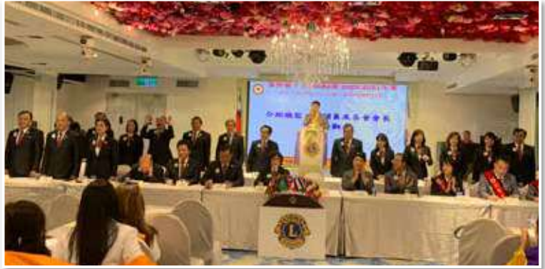
圖文 / 採訪委員 劉麗卿