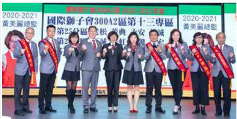
文：採訪委員林惠蓮