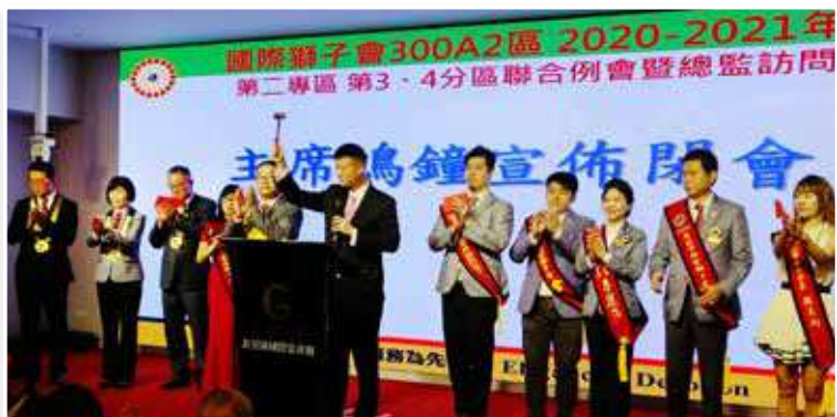
圖文 / 採訪委員 許聖楷