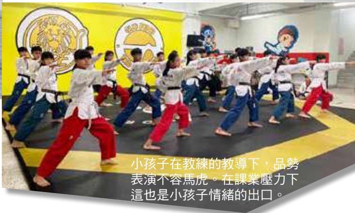
小孩子在教練的教導下，品勢 表演不容馬虎。在課業壓力下 這也是小孩子情緒的出口。

名。獅子會長期資助與鼓勵，花蓮孩童奮發上進的例子不勝枚舉，令在座獅友寶眷們既敬佩又感動。